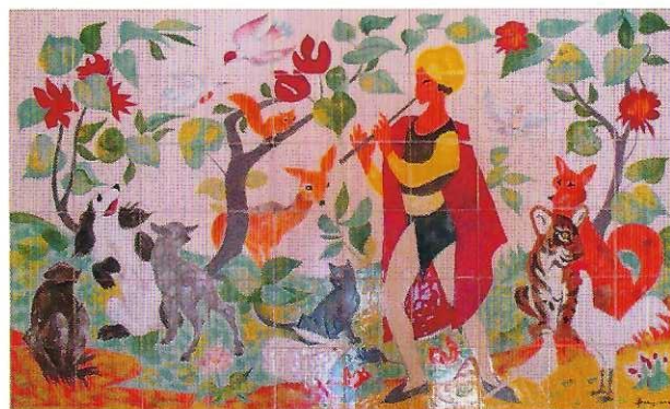
DEC_220 - Flûte enchantée - Faïence 1978 - 90x150 Œuvre donnée par la Ville de Rezé à la Ville de Saint-Hilaire-de-Riez Œuvre sauvée grâce à l'action de l'association.